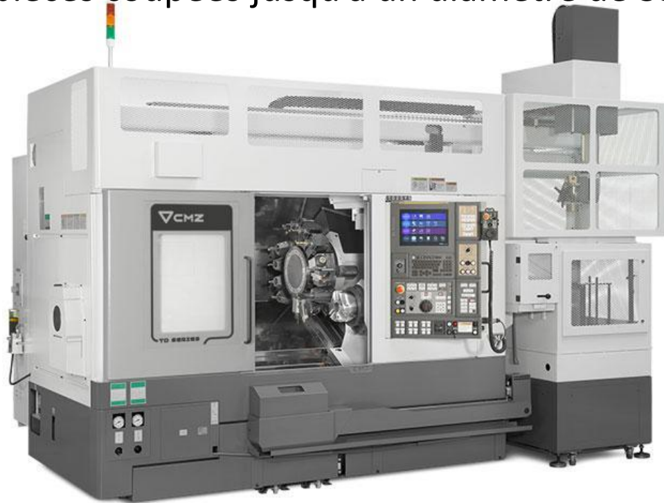
Machine équipée avec robot Gantry.

Cette nouvelle acquisition nous permettra d'accroître notre productivité dans des séries de pièces coupées jusqu'à un diamètre de 350 mm ainsi que le volumen des lots.