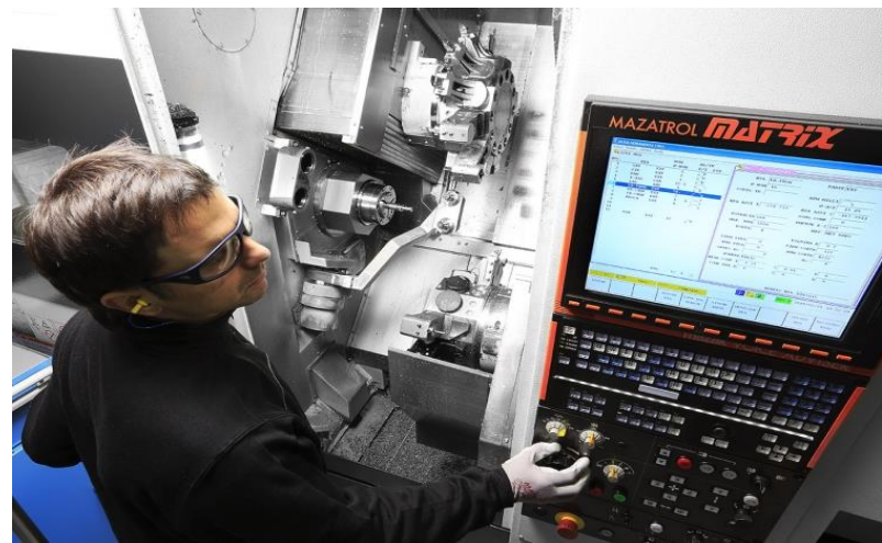
GRACIANO GT 400