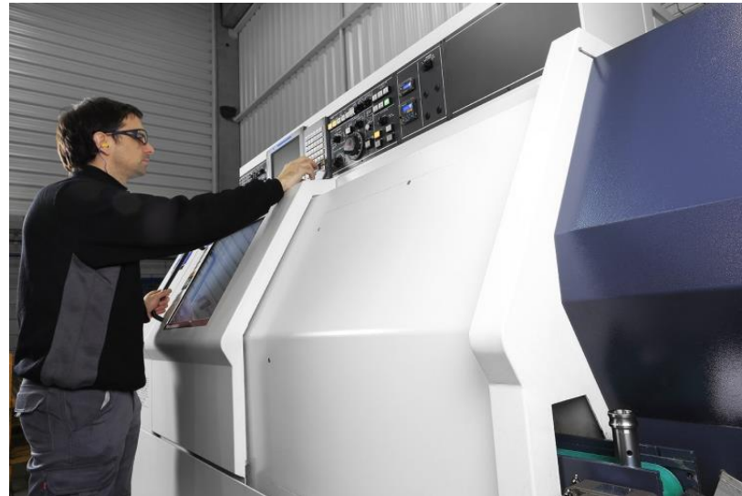
GILDEMEISTER CTX 320