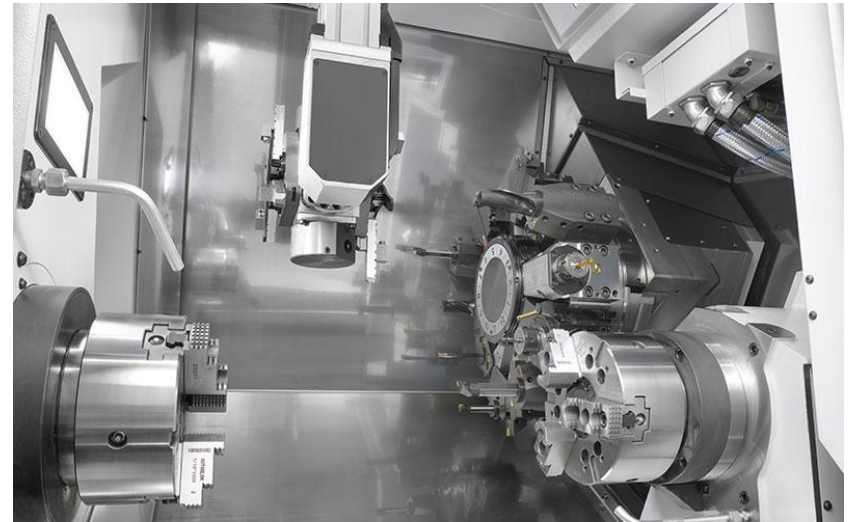
Possibilité d'outil motorisé dans les 16 positions de la tourelle.