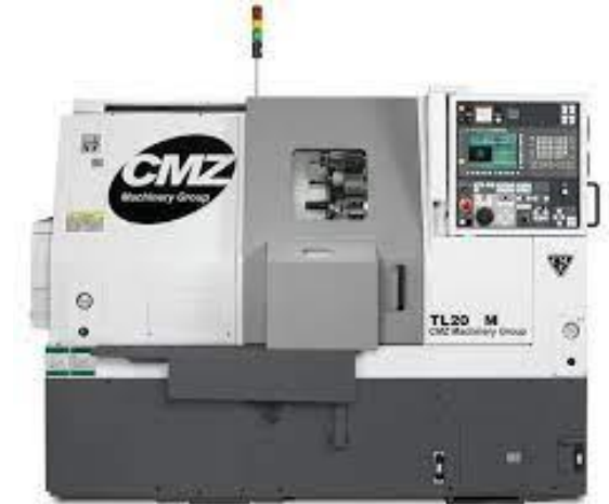
CMZ TL 20