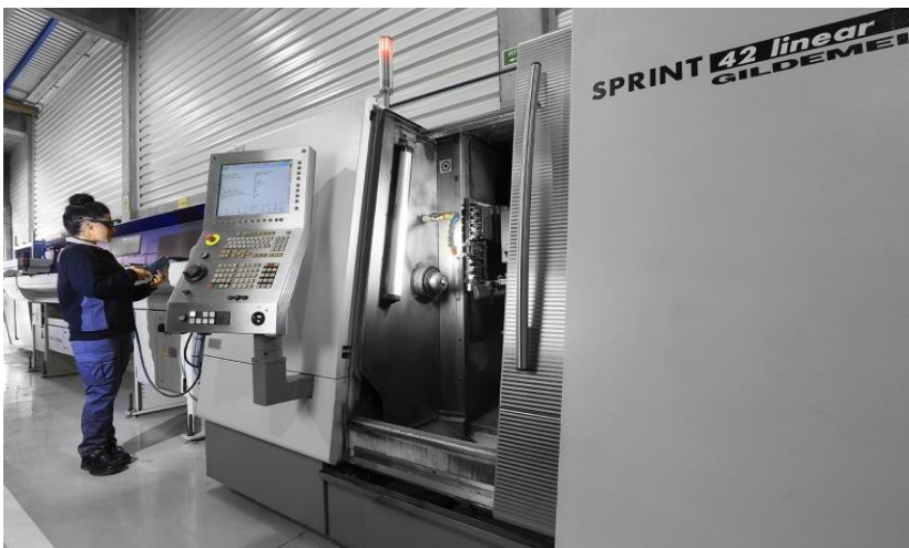
GILDEMEISTER SPRINT 42