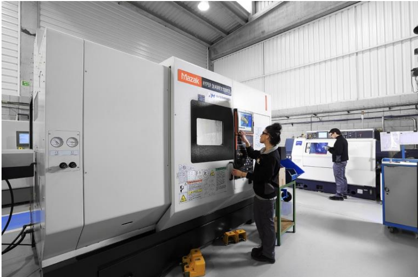
MAZAK HYPER QUADREX 150 MSY